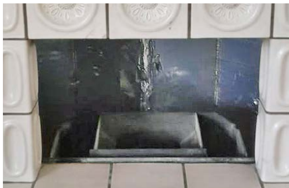
Avant : cheminée ouverte