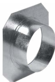
Raccord d'air chaud pour tube flexible en aluminium 3 tailles: Ø 100, Ø 125 und Ø 150 mm