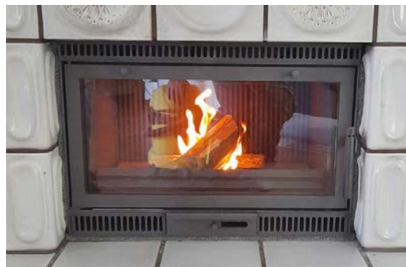
Après : avec cassette de cheminée sur mesure