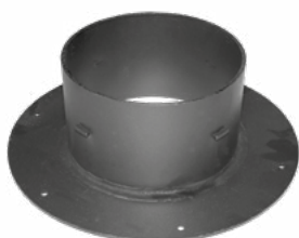
Raccord de gaz de fumée Ø 150 mm ou Ø 180 mm

Les accessoires suivants sont nécessaires pour l'installation des cassettes de cheminée FRAM :